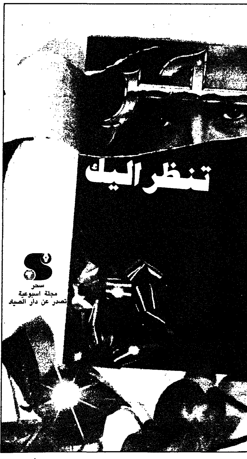
تنظر اليك مجلة أسبوعية تصدر عن دار الصياد

وكانت الانتخابات الأولى انتخابات متعددة الأحزاب، تجري في الجزائر منذ حصولها على الاستقلال لعام ١٩٦٢. وكانت نتائج الانتخابات في الغالب في الولايات السبع بعد أن أكد القضاء وقوع مخالفت تضمنت سرقة صناديق الاقتراع وتزوير توكيلات بالتصويت.